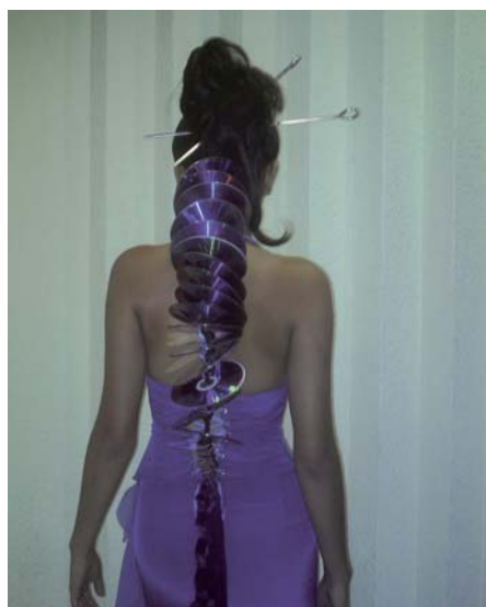
Moño fantasía realizado con Cds.