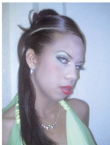
Dos peinados en detalle.