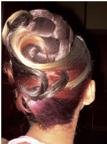
Diversos trabajos realizados en Barquisimeto donde se notan el uso de las nuevas tendencias "Colores Rebeldes".